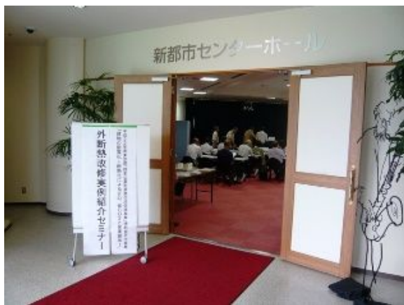
外断熱改修実例紹介セミナー（午後）