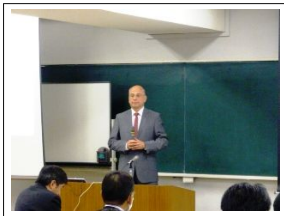
講演するホルガーメルケル博士