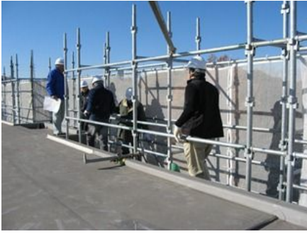
管理組合立会いの検査