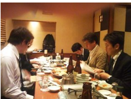
神奈川県外断熱ネットワーク発会式