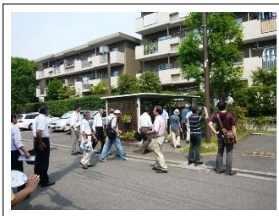
ホームタウン南大沢団地見学会（午前中）