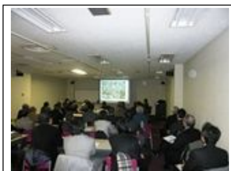
新春特別講演会風景