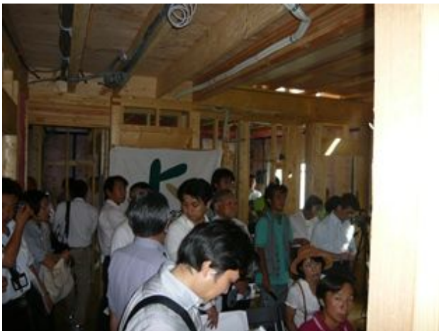
施工現場見学会風景