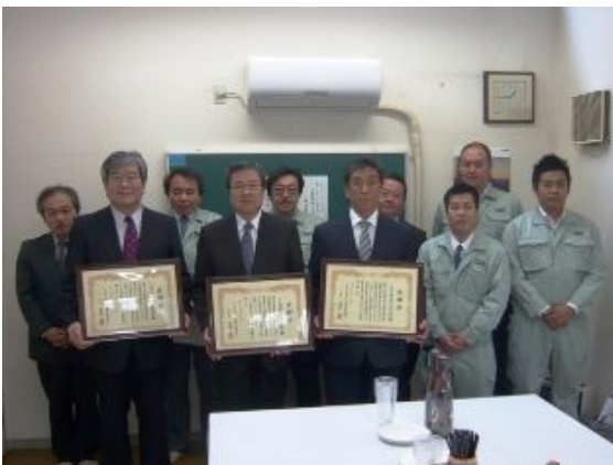
管理組合からの感謝状

当法人が外断熱工事の設計・監理を行った、八王子市南大沢4-21のホームタウン南大沢-4（中層）団地の外断熱改修工事が完成し管理組合に引き渡された。本工事の外断熱設計・監理に関して外断熱推進会議に南大沢管理組合理事長より感謝状が送られた。